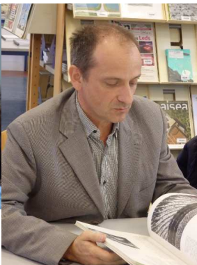
Un conférencier passionnant