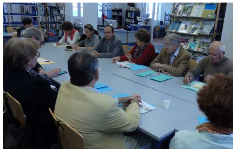
Une assemblée très attentive