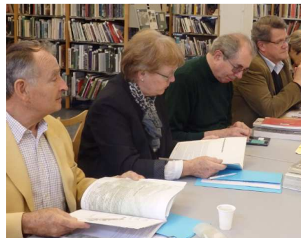
Un public studieux